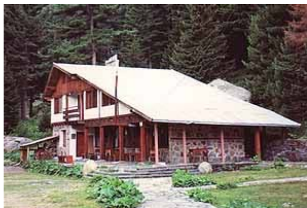
фиг. 13 Хижа “Скакавица”

Рила е обект със значение във вътрешния и международния туризъм. Известни курортни центрове са Боровец, Говедарци, Сем-ково, а Сапарева баня и Долна баня са балнеоцентрове.