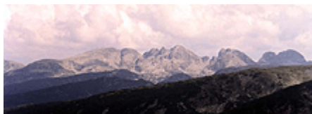
фиг. 1 Поглед към Мальовица от Седемте езера

Рила е част от Рило-Родопския масив и е най-високата планина не само в България, а и на Балканския полуостров. Тя е средишна планина на полуострова и е нагов главен орографски и хидрографски възел.