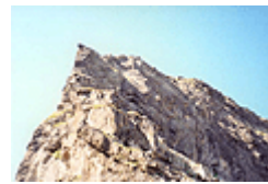
фиг. 7 Вр. Злия зъб

Вазоввръшкият дял се простира между долините на реките Джерман, Урдина, Елешница, Малка Друшлявица и Друшлявица. Заема средишно положение в Северозападна Рила, а по билото му минава балканският вододел. Най-висок връх на дела е Вазов връх, на който съперничи югоизточният му съсед Додов връх. Двата върха оформят внушителния Урдин циркус. На северозапад от Вазов връх се намира билната заравненост Раздела – важно туристическо кръстовище, а в западното му подножие се простира Мокришкият циркус, разделен от едноименния рид на Малка и Голяма Мокрица. От Вазов връх в североизточна посока се спуска широко разлатият Зелен рид, заграждащ Урдиния циркус и долината на Урдина река от северозапад. На север от върха на главното вододелно било се издига островърхата пирамида на вр. Хайдута, чиито склонове се спускат към циркусите на Седемте езера и на Черни Искър. Вр. Върла, разположен югозападно от Вазов връх, свързва последния с Черни рид, който се спуска на юг към долината на Рилска река. В края на рида се издига вр. Баучер.