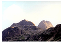
фиг. 6 Вр. Мальовица

катерачни турове с най-висока категория на трудност. Алпийския си облик делът дължи на върховете Мальовица, Елени връх, Орловец, Злия зъб, Двуглав, Ловница и Купените. На изток от Купените се издигат върховете Попова капа, Лопушки връх, Голям Мечит и Будачки камък. Най-висок връх на Мальовишкия дял е Голям Купен. На север от главното Мальовишко било към долината на р. Черни Искър се спускат няколко рида – Лопушница, Голия рид, Ръждавица, Калбура, които заграждат циркусите и коритните долини на р. Лопушница, Прека река и р. Мальовица. Стръмният скалист склон на дела между Ловница и Елени връх е прорязан от улеите на Злите потоци – пътища на лавини и каменопади.