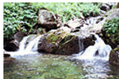
фиг. 4 По р. Скакавица