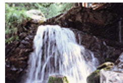
фиг.5 Водопад по р. Скакавица

Маринковишкият дял се свързва чрез седл. Кобилино бранище със Северозападна Рила. Неговото било е в посока от изток на запад. На него се извисяват върховете Възела, Маринковица, Погледец и Водни връх. От вр. Погледец между долините на Горна и Долна Лева река се врязва скалистият едноименен рид, в чийто северен склон сред клеков пояс се намира езерото Йозола.