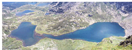
фиг. 11 Ез. Бъбрека