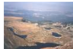
фиг. 12 Седемте езера

Главното вододелно било на Рила разпределя водите ъ между Черноморския и Беломорския басейн. Към Черноморския басейн принадлежи само р. Искър. Тя отвотднява северните склонове на планината от долината на Черни (Прав) Искър до коритната долина на Бели Искър, а чрез р. Мусаленска Бистрица – и район на изток от Бели Искър. Третият им събрат (Леви Искър) отвотднява западните склонове на Скакавишкото било и циркусите под Водни връх. Към Бело-