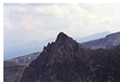
фиг. 8 Вр. Хайдута (Харамията)

Вазоввръшкият дял се простира между долините на реките Джерман, Урдина, Елешница, Малка Друшлявица и Друшлявица. Заема средишно положение в Северозападна Рила, а по билото му минава балканският вододел. Най-висок връх на дела е Вазов връх, на който съперничи югоизточният му съсед Додов връх. Двата върха оформят внушителния Урдин циркус. На северозапад от Вазов връх се намира билната заравненост Раздела – важно туристическо кръстовище, а в западното му подножие се простира Мокришкият циркус, разделен от едноименния рид на Малка и Голяма Мокрица. От Вазов връх в североизточна посока се спуска широко разлатият Зелен рид, заграждащ Урдиния циркус и долината на Урдина река от северозапад. На север от върха на главното вододелно било се издига островърхата пирамида на вр. Хайдута, чиито склонове се спускат към циркусите на Седемте езера и на Черни Искър. Вр. Върла, разположен югозападно от Вазов връх, свързва последния с Черни рид, който се спуска на юг към долината на Рилска река. В края на рида се издига вр. Баучер.