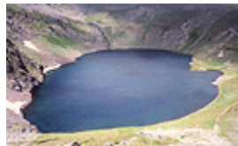
фиг. 9 Ез. Окото

Подхранването на реките в Рила е предимно от топенето на снеговете и от валежите. Много от реките са с постоянни водоизточници – циркусните езера и мочурищата. През по-голямата част от годината езерата са покрити с лед. За броя на постоянните рилски езера се дават противоречащи данни. Според едни източници техният брой е 140, а според други – 189, без да се смятат 30 малки (с площ 1-2 дка) и плитки езера, които през лятото пресъхват. Езерата в Рила са групирани по няколко в отделни циркуси, но не е малък броят и на единичните езера. От езерните групи най-известни са Седемте езера, Урдините езера, езерата в Мусалунския циркус и др. Най-високо разположено е Леденото езеро – в северното подножие на вр. Мусала. Смардливото езеро в Средна Рила е най-голямото циркусно езеро на Балканския полуостров (212 дка), а най-дълбокото от рилските езера е Окото (второто от групата на Седемте езера) – 37,5m.