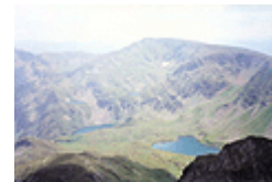
фиг. 10 Урдините езера